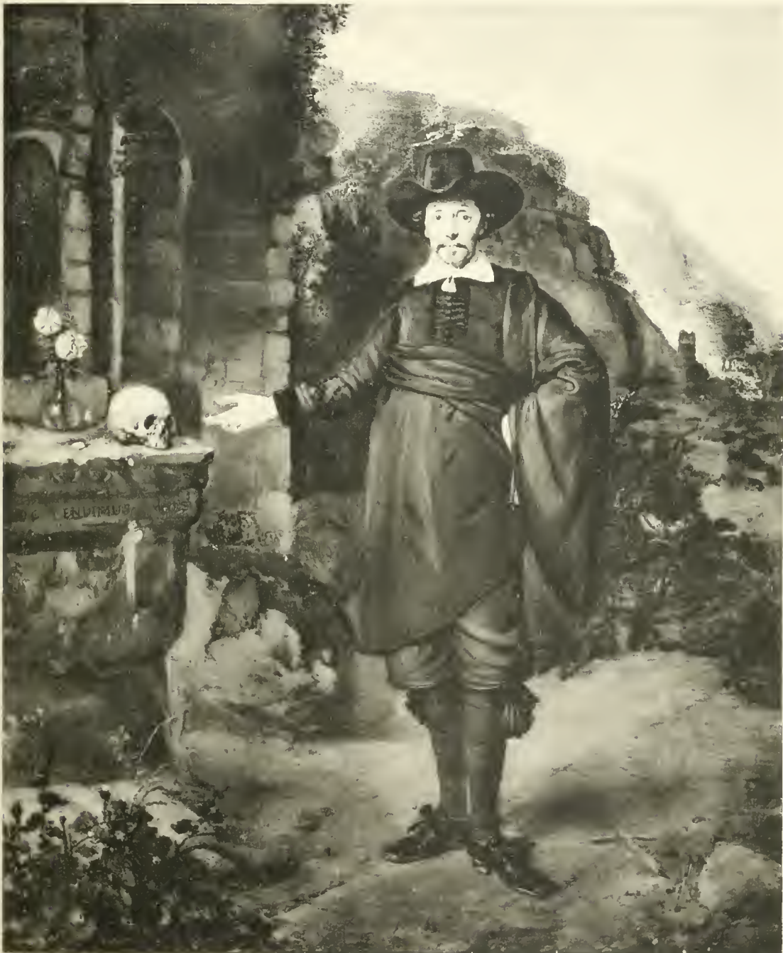
TH. DE KEYSER

TERCENTENAIRE DE REMBRANDT - EXPOSITION FREDERIK MULLER & CIE